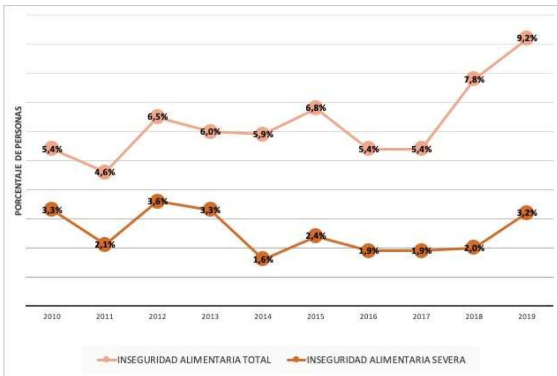
Gráfico n° 1: Inseguridad Alimentaria Total y Severa en CABA. Años 2010-2019.

Fuente: elaboración propia a partir de los datos de la Encuesta de la Deuda Social Argentina.